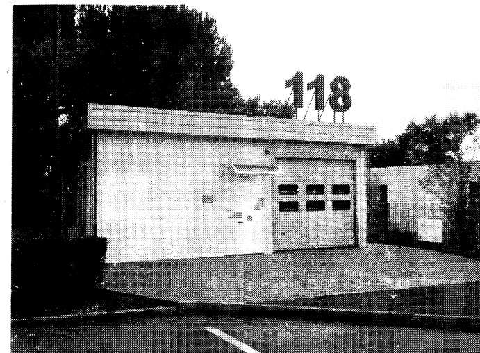
»» La sede del 118 di San Gemini

Cavilli e iter burocratici La postazione è bloccata per colpa di una delibera a quanto sembra ancora mancante, l'Amministrazione decisa a risolvere il problema